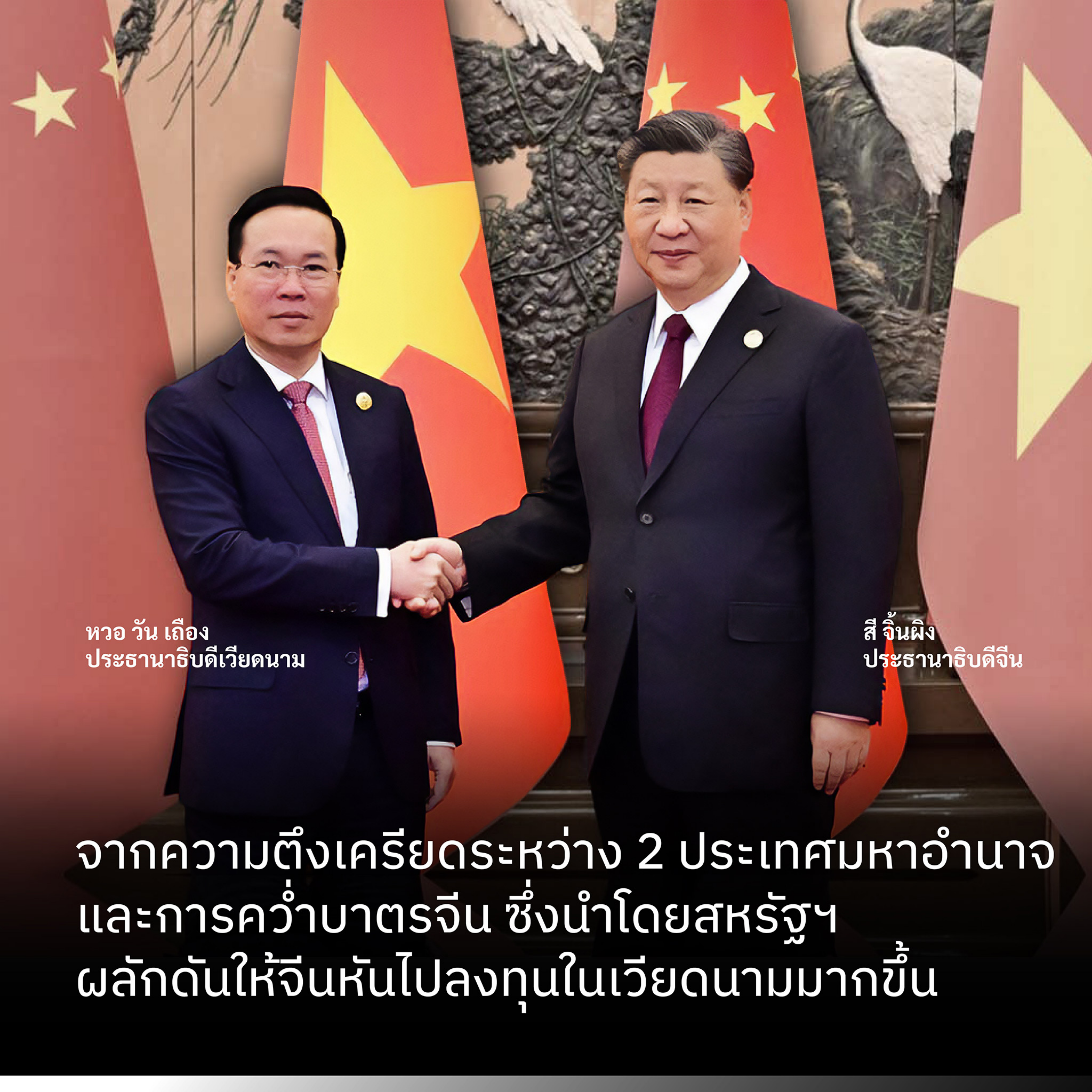
หวอ วัน เถื่อง ประธานาธิบดีเวียดนาม