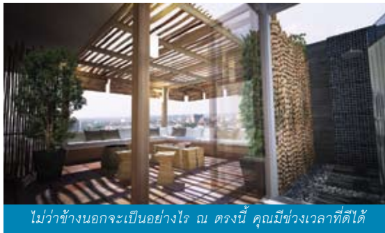
ไม่ว่าข้างนอกจะเป็นอย่างไร ณ ตรงนี้ คุณมีช่วงเวลาที่ดีได้