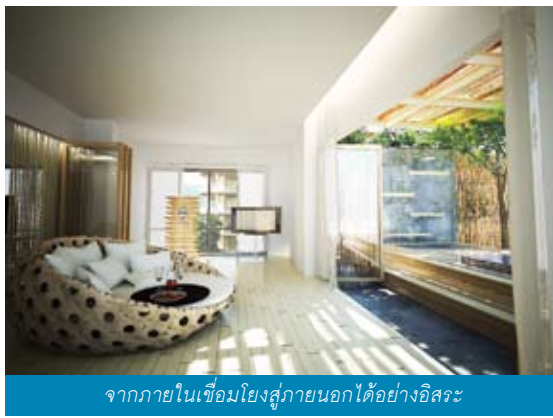
จากภายในเชื่อมโยงสู่ภายนอกได้อย่างอิสระ