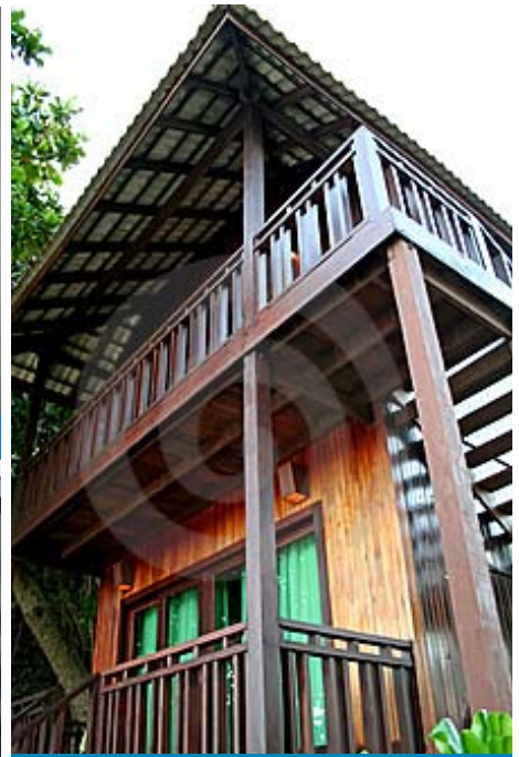
นอกชานและระเบียง ลักษณะพิเศษของบ้านเมืองร้อน ที่เอื้อต่อการผ่อนคลาย