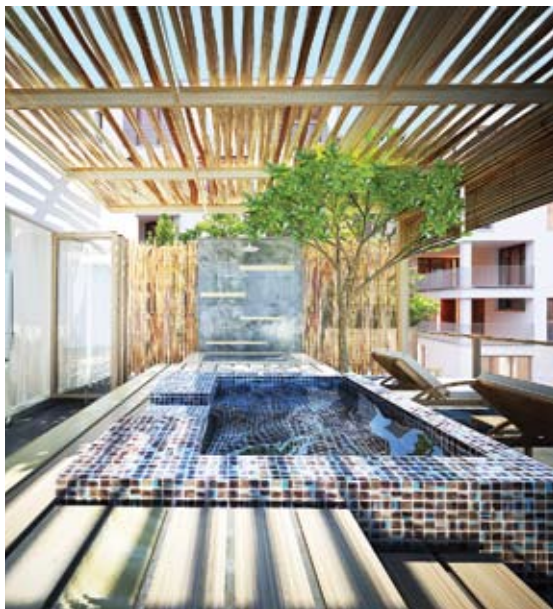
มุมมองที่ต่อเนื่องผสานธรรมชาติไว้ใกล้คุณอย่างลงตัว