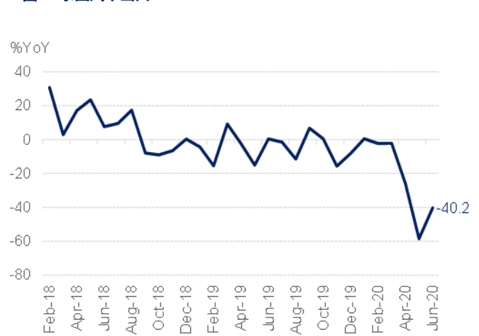
圖 2: 泰國汽車出口