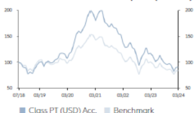
Performance Overview Indexed Performance since Inception (Bid-Bid)