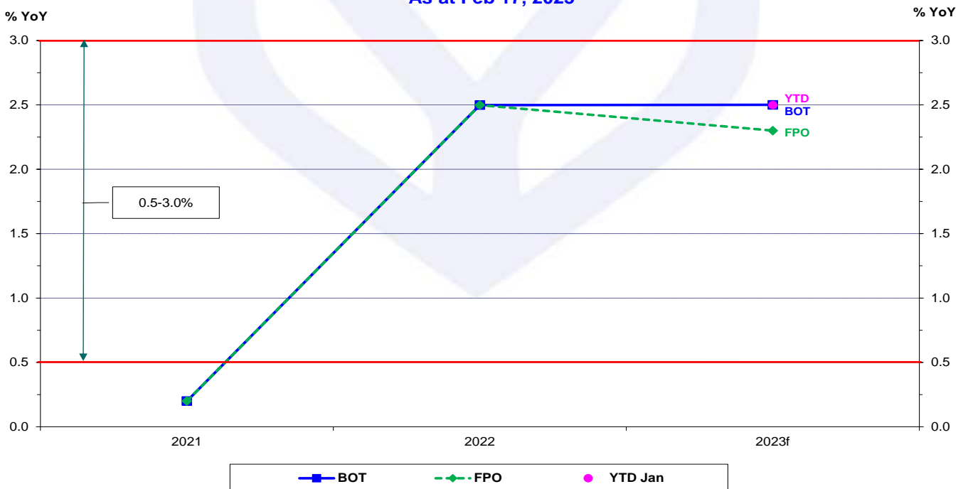
TH: Core Inflation Latest Forecast by Major Institutions As at Feb 17, 2023