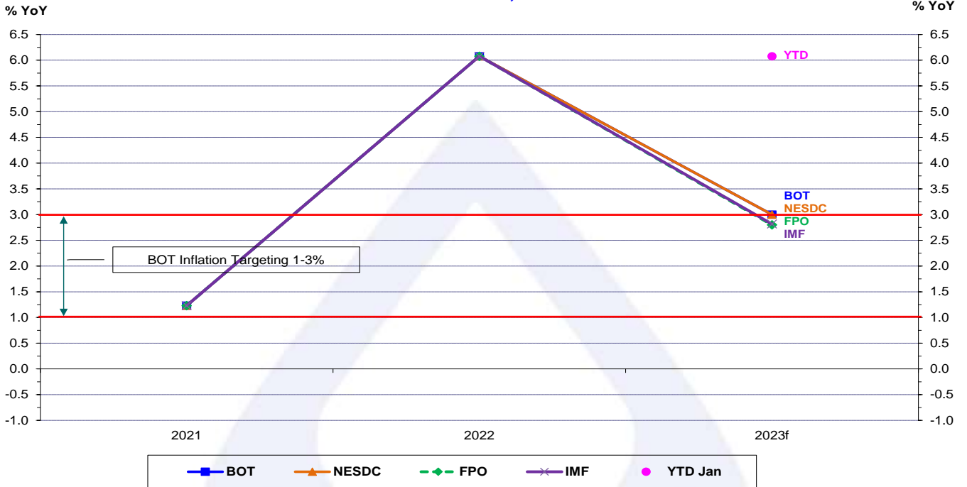
TH: Headline Inflation Latest Forecast by Major Institutions As at Feb 17, 2023